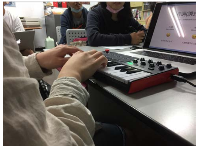
講師示範彈奏各種音調