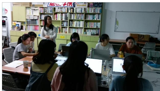
業師檢討組員們的報告