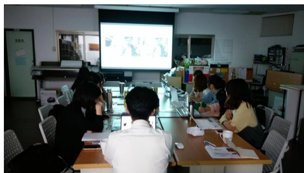
業師講解畫面尺寸的影像感差別