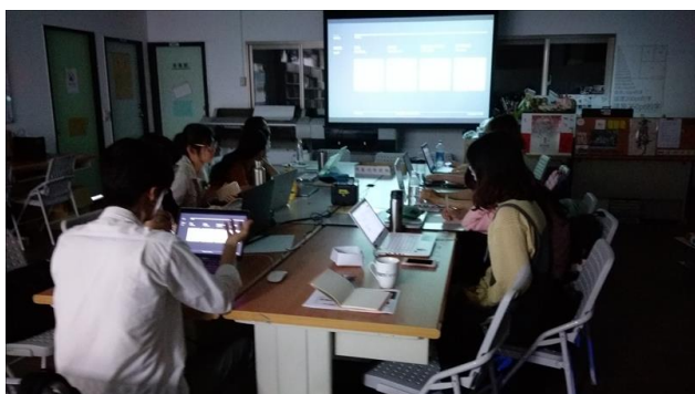
業師為課程進行講解

在各組分組以後，依據各自挑選的網站進行規劃改版的報告，同時以最簡要的 wireframe 草稿圖展示修正。業師在現場給予建議和指導。這堂課業師以提升美感為主軸，從尺寸影響畫面情境與張力的差別，如 16：9 能營造電影感，而 4：3 偏向照片。介紹黃金比例的應用，以及字體上的使用，包括舊體（Old Style）能夠帶出時代感，現代羅馬體的襯線對比度高，相對不適合於內文，並介紹在排版上應當避免孤行、寡行及避頭點。同時從歷史的角度說明部分字體的設計由來，以及歐文與漢字的差別。顏色在整體版面的安排，也將影響品牌的視覺度與網站使用的引導性，業師以幾個案例來與同學們介紹，單色、雙色、系列色、整合色等的網頁安排，使概念能夠更清楚。最後出個人與小組的作業，個人以 Daily UI 中找尋與網頁相關的介面練習，仿作一次，小組則是繳交各組網站的 Mockup。