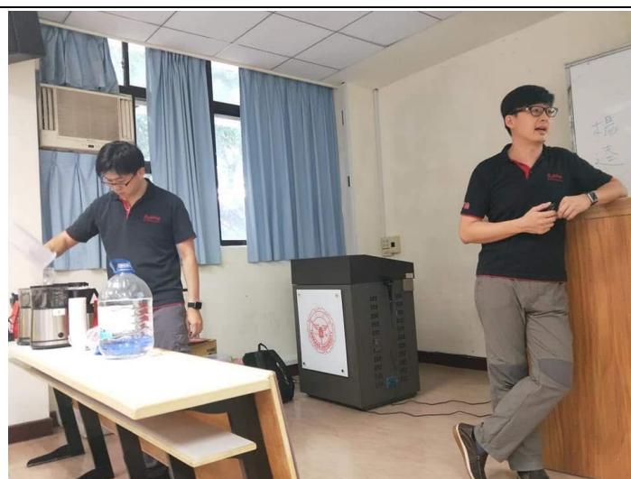
講師示範如何煮咖啡(2)