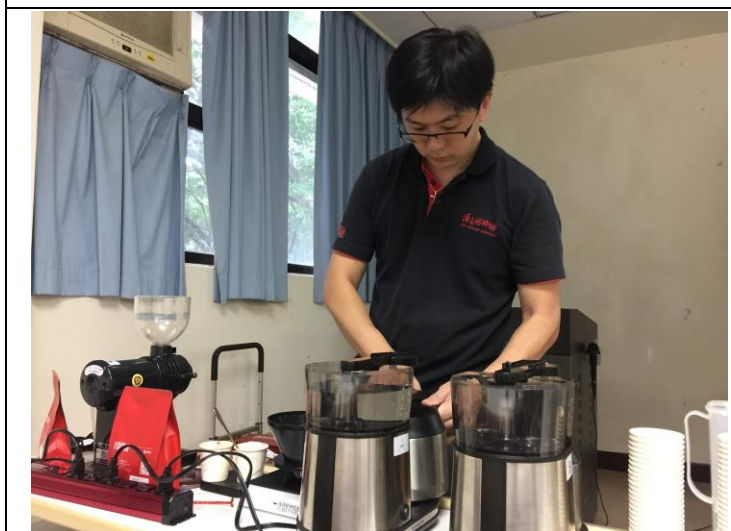
講師示範如何煮咖啡(1)