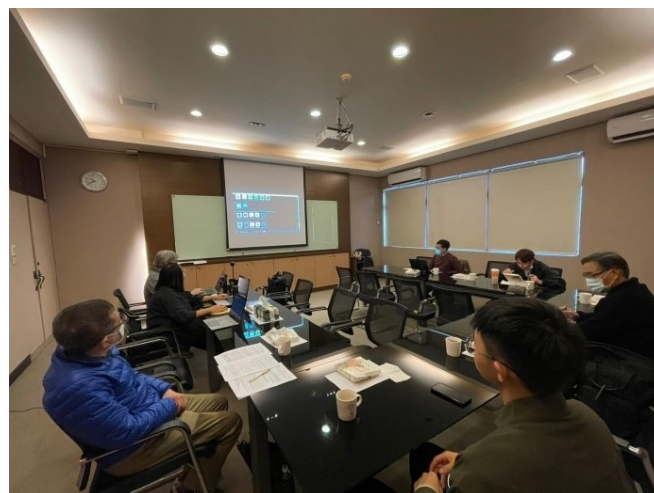
講者實際演示系統的操作過程