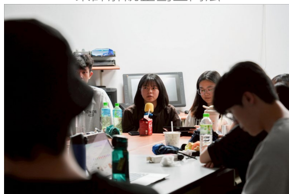
同學向業師分享自己已短音製作過程