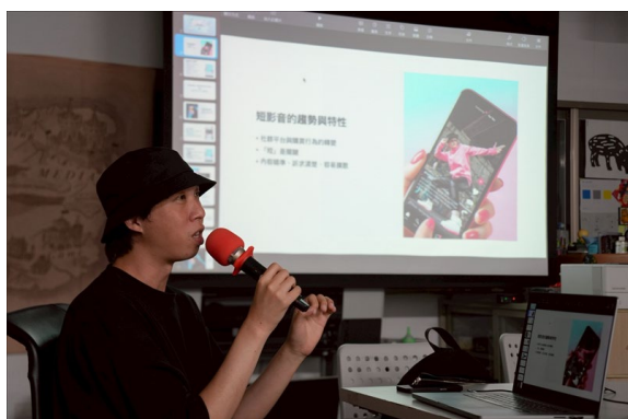
業師說明短影音的趨勢與特性