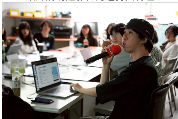
業師講解與分享案例時同學認真聆聽