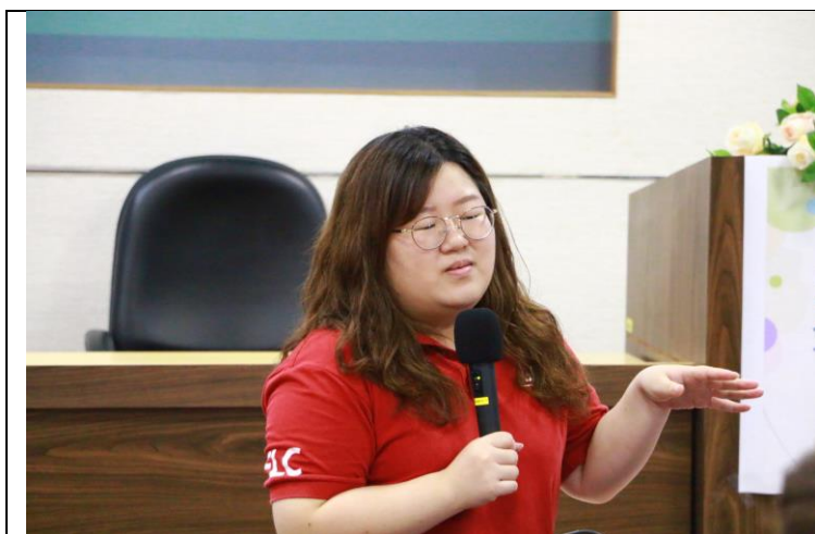
助教以學生的角度回答與會老師問題