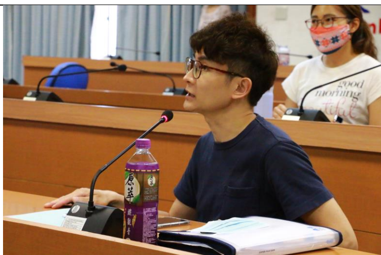
與會老師提出計畫花費之時間心力，是否會影響學生其他學科的成績問題