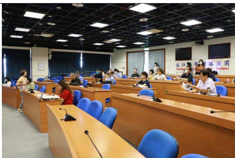
與會老師專心聆聽謝主任分享全球在地之頂石實踐