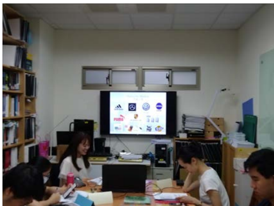
介紹常見德國事物