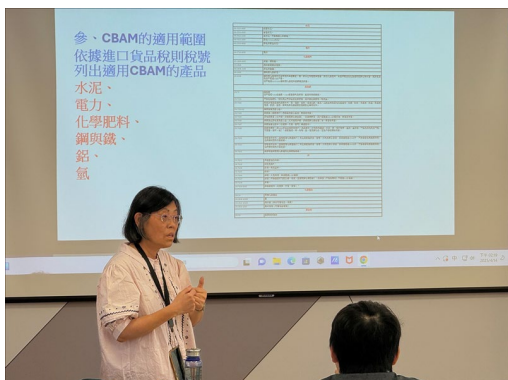
講師講解 CBAM 適用產業，並解析海關稅則細項。