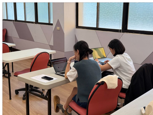
學生上課間紀錄課程內容並撰寫筆記，深化吸收與反思。