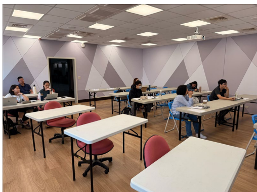
學員們聚精會神，課堂互動良好，專注於實務制度的細節。

經滿意度問卷調查，共有 7 人填寫，其中對本次活動非常滿意的平均分數為 5.43 分；對課程主題內容切合期望的平均分數為 5.43 分；對講師的安排感到滿意的平均分數為 5.71 分；對課程場地與設施合宜的平均分數為 5.43 分；未來類似的課程會想主動參與的平均分數為 5.43 分 (各項分數總分皆為 6 分)。