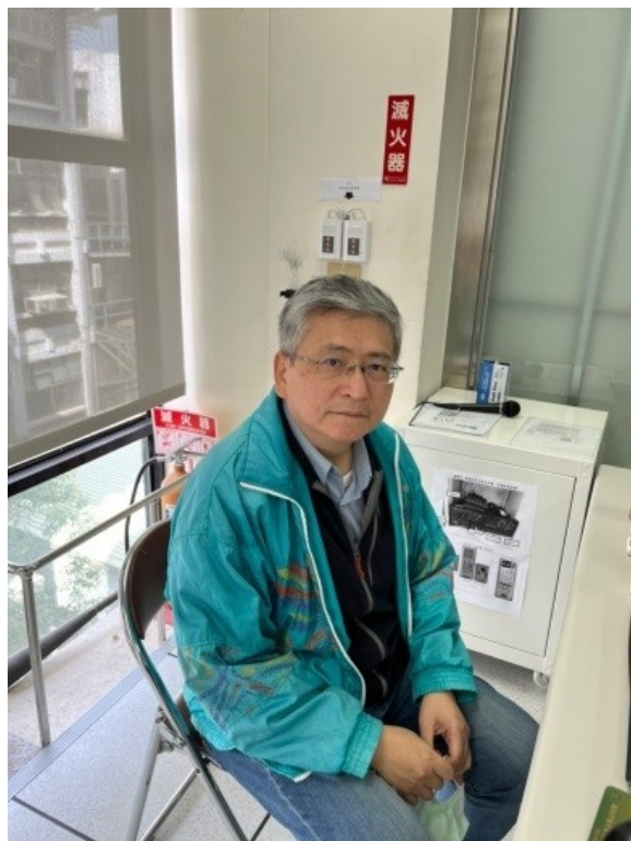
現場參與之團隊成員教師_展示其實作範例