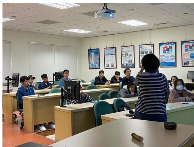
演講者與學生熱烈地探討問題