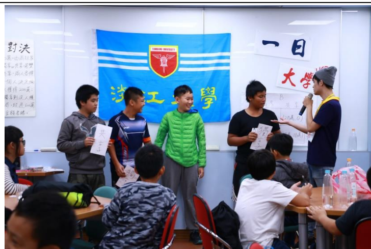
第三場經濟小遊戲「王牌對決」