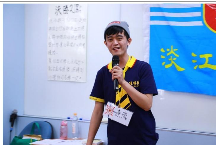
課程助教說明遊戲規則