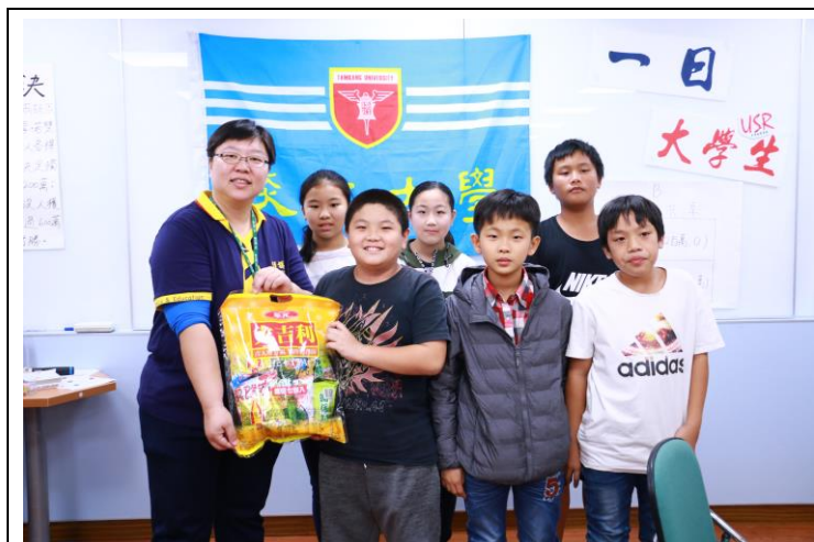
林老師頒發獎品給第一名團隊