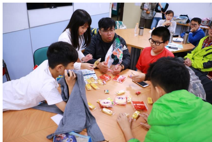
第二場經濟小遊戲是「飢餓遊戲」