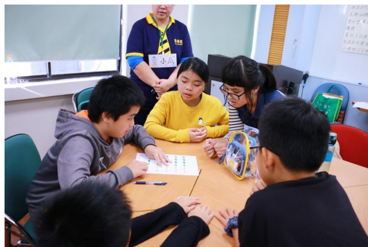
第一場經濟小遊戲「決戰 21 點」