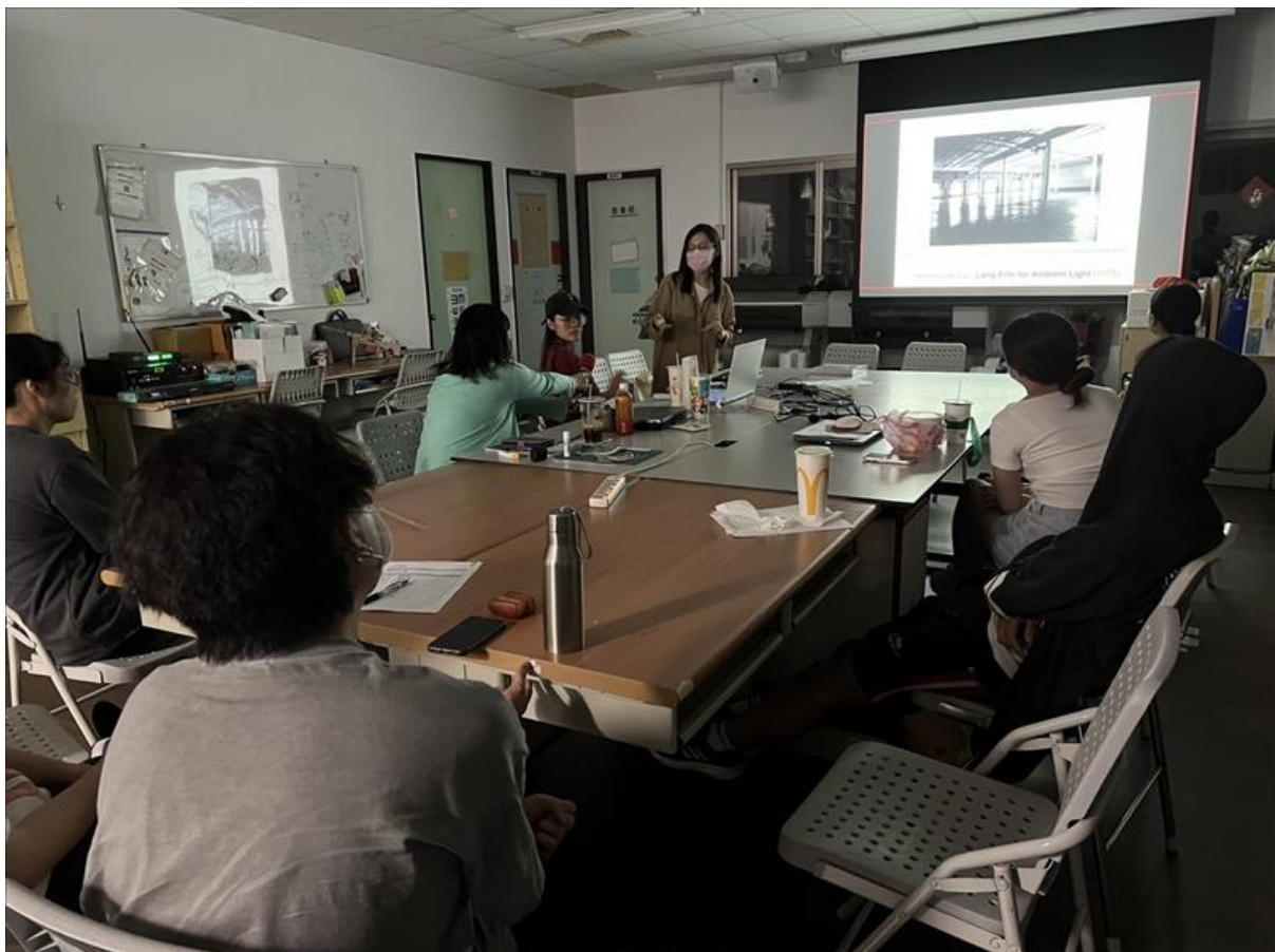
老師與同學進行問題探討

希望同學們可以經過這次的課程學習到影像創作的不同視角，在往後可以跳脫傳統思維，以創新的角度來製作影像創作。