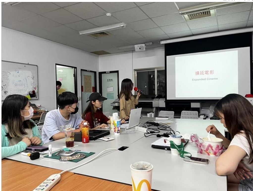
老師介紹擴延電影