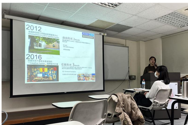
分享到國外駐村的經驗