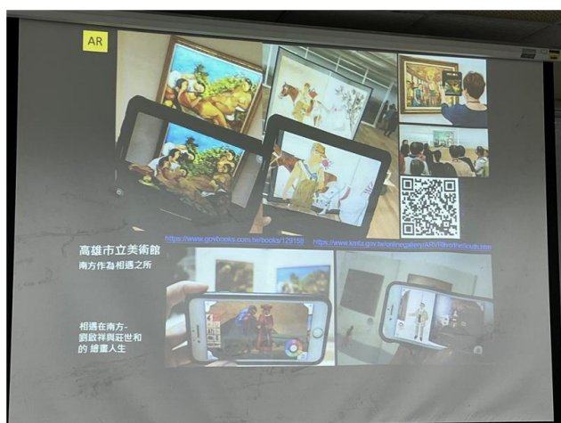
講師所製作的 AR 互動書

第三階段，講師分享到國外駐村的經驗和一些藝術相關的資訊、管道。講師也給大家建議，因為藝術家經常會與跨領域的團隊進行合作，所以最好要具備專案經理的能力，這樣能夠明確規劃期程、妥善的分配資源和人力。最後她也提醒同學們：藝術創作的路途會很艱辛，所以要知道什麼東西是自己需要的、所擁有的，要能夠賺取自立生活的金錢，才能持續的創作下去。