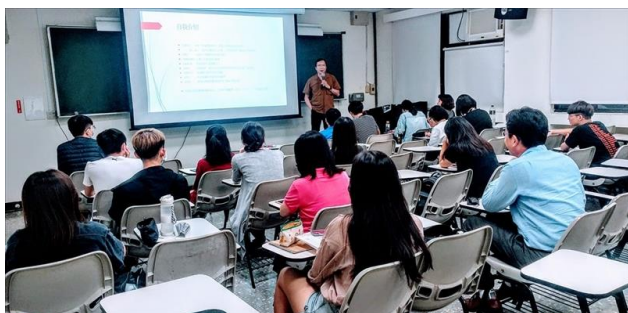
老師開場介紹《反對者陳獨秀》的拍攝機緣

本講座將以張釗維導演所企劃與執行的紀錄片《反對者陳獨秀》為例，引導同學認識紀錄片的材料、題材、影像、文字、歷史、社會、藝術等等的理論與實務工作模式。導演闡釋了拍攝孫中山的對立面的生命機緣。並多所強調紀錄片工作處理中的「關鍵瞬間」，同時提示有意義的敘事是來自文藝、大於文藝，來自歷史，大於歷史，來自台灣，大於台灣等重要理念。進一步說明與分析紀錄片的美學、倫理、價值觀跟時代之間的辯證關係，期望同學都能在平日多積累材料視野，日後才可能有追求前衛創新的人格與落實的契機。