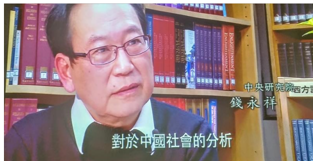
說明引用材料、邀訪學者的相關環節問題