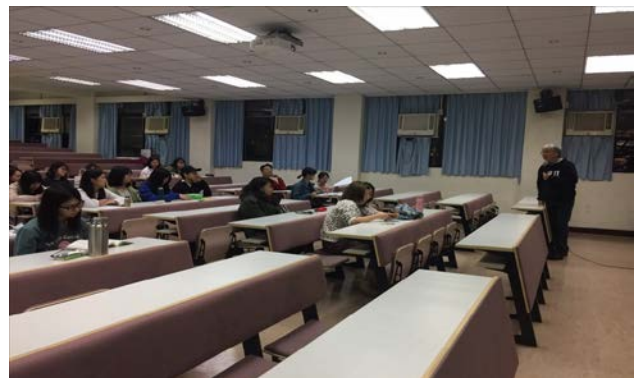
講者上課與同學聽講情形