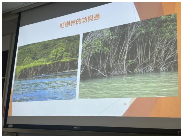
探討生態的過去與現況