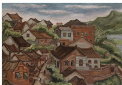
陳澄波筆下的淡水