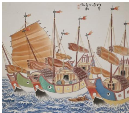
郭雪湖筆下的淡水港