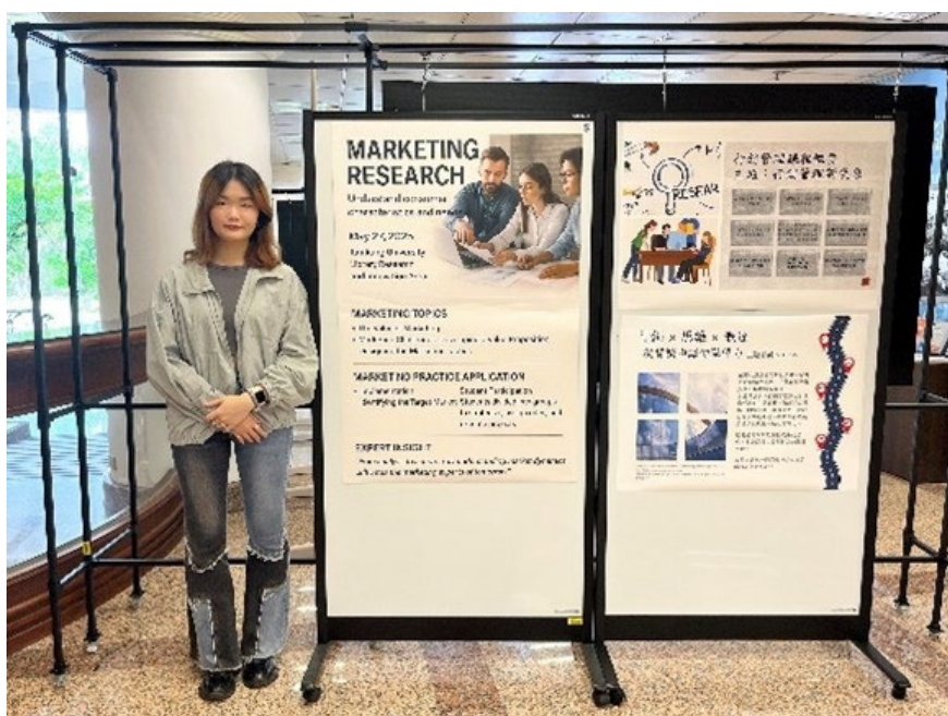
參展學生與作品合照