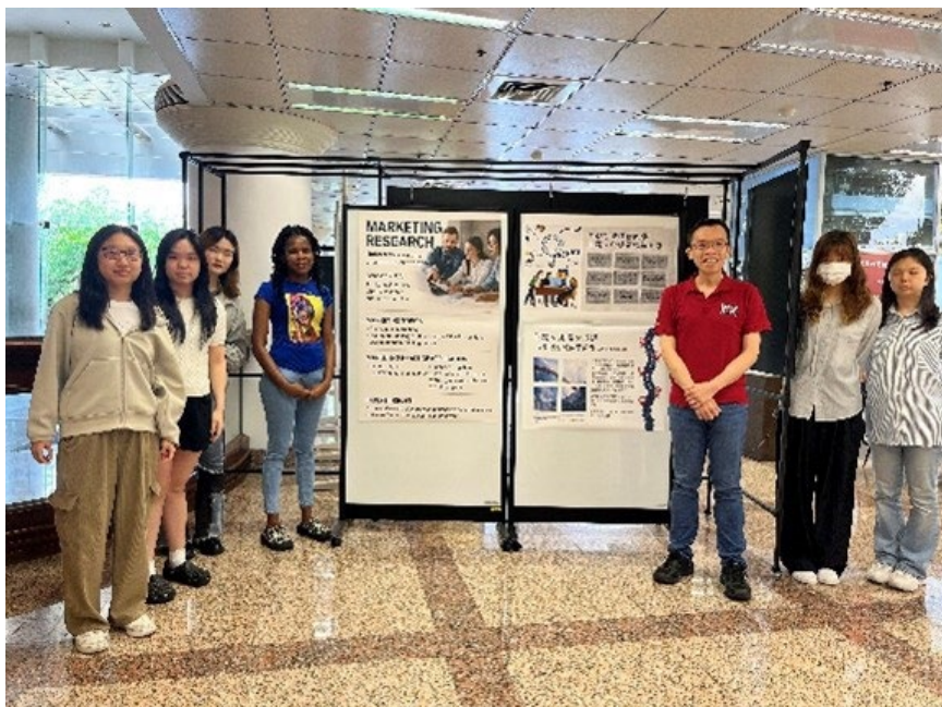
參展學生與作品合照