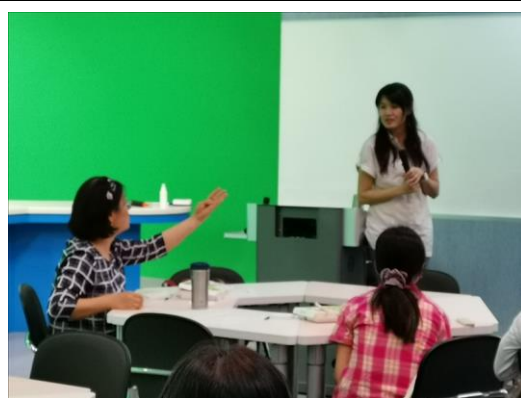
與會教師交流意見