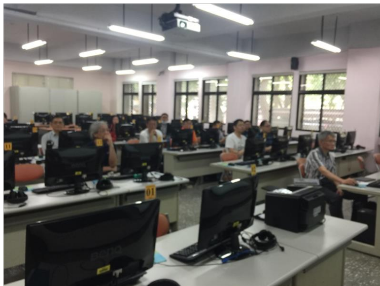
iClass 學習平台成績管理工作坊(0515-1)

本次課程以畢業班授課老師為主，介紹 iClass 成績介接功能，能讓教師了解畢業班成績上傳之操作。