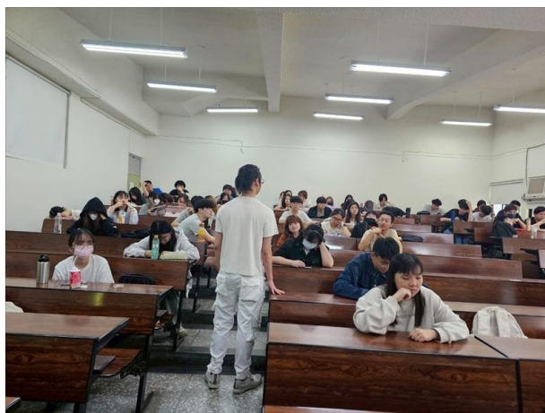
講師分享自身經歷與勇者故事