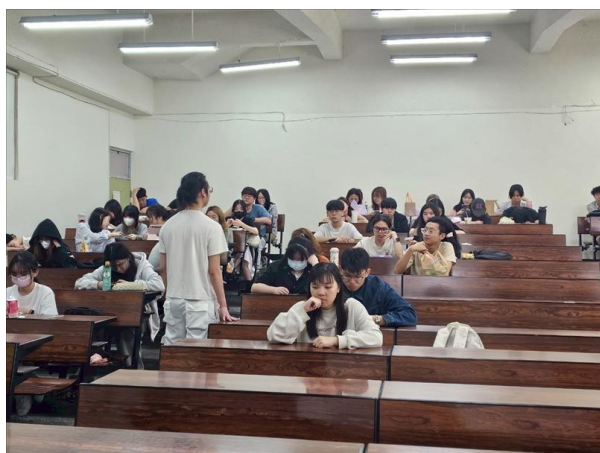
學生們專心聆聽與互動踴躍