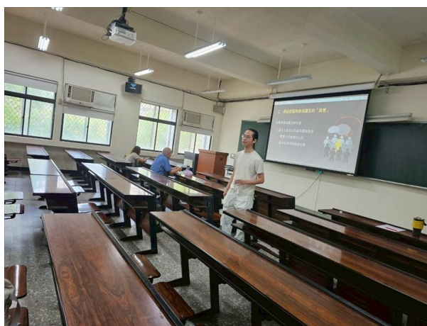
身心障礙倡議之路