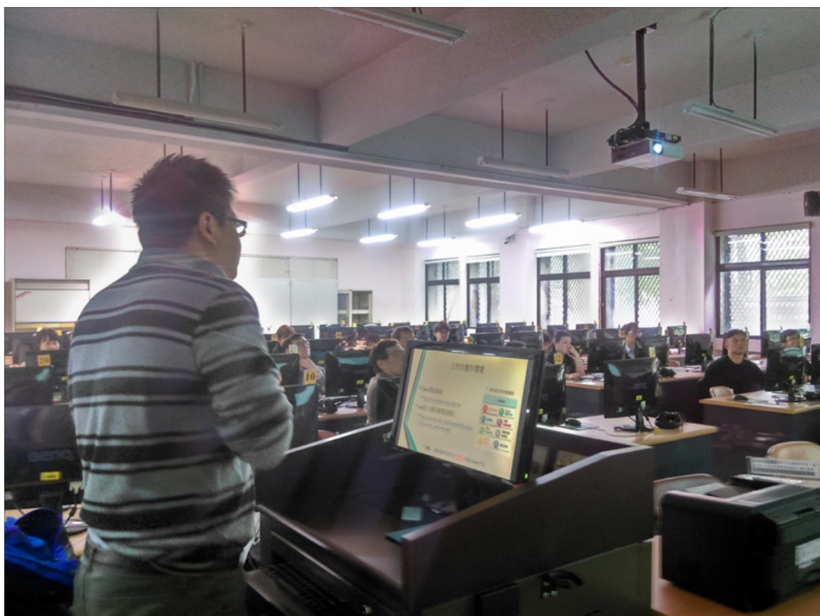
iClass 學習平台成績管理工作坊(1210-2)