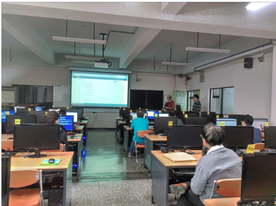
iClass 學習平台成績管理工作坊(1210-1)