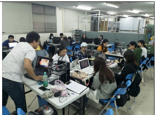
3D 列印講師講解實況