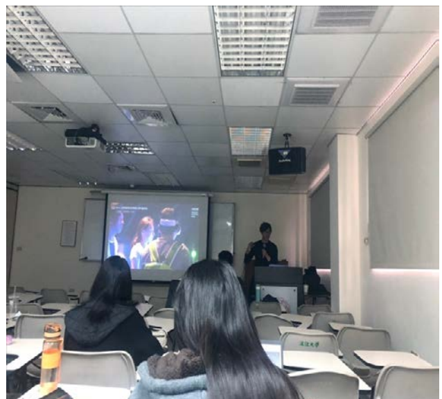
實際展示過去創意案例