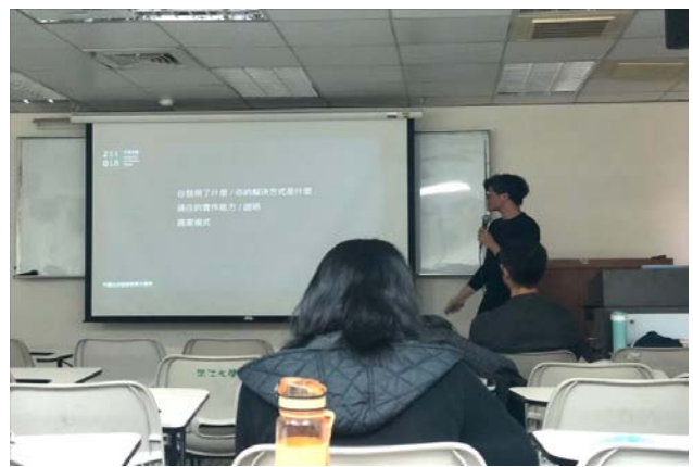
講述如何將自身興趣投入對應的產業，商業模式大致為何