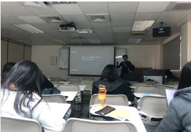
詢問同學自身的興趣、優勢為何

講師提出許多案例進行分享，包括劉德華、薛之謙等人演唱會的設計和呈現方式，如鵲橋和薛之謙演唱會中升降的花朵，都需要高度掌握技術，在快速找出素材，才能進入真正的試驗階段，正因為包括各個領域不同技術，因此懂的跨領域結合十分重要，應該從現在起培養溝通和與人協調的能力。在演講的後半部，講師則著重在講解如何展示未成形構想，建議同學們可以先找出過去曾有過的類似作品，又或者是呈現有相關原理的事務給業者看，提供同學許多良好的建議。