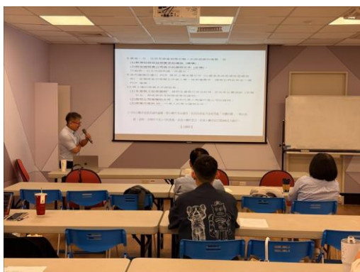
老師正在講解 CBAM 填報最後步驟，包括 PDF 格式、法人證明等需附加的資料。