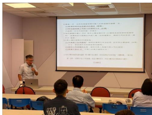
老師一邊操作筆電、一邊逐條解釋填報所需的欄位與注意事項。