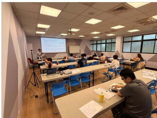
學員們聚精會神聽講並查看講義，教室氛圍專注且實務導向。

經滿意度問卷調查，共有 9 人填寫，其中對本次活動非常滿意的平均分數為 5.78 分；對課程主題內容切合期望的平均分數為 5.78 分；對講師的安排感到滿意的平均分數為 6 分；對課程場地與設施合宜的平均分數為 5.67 分；未來類似的課程會想主動參與的平均分數為 5.89 分(各項分數總分皆 6 分)。