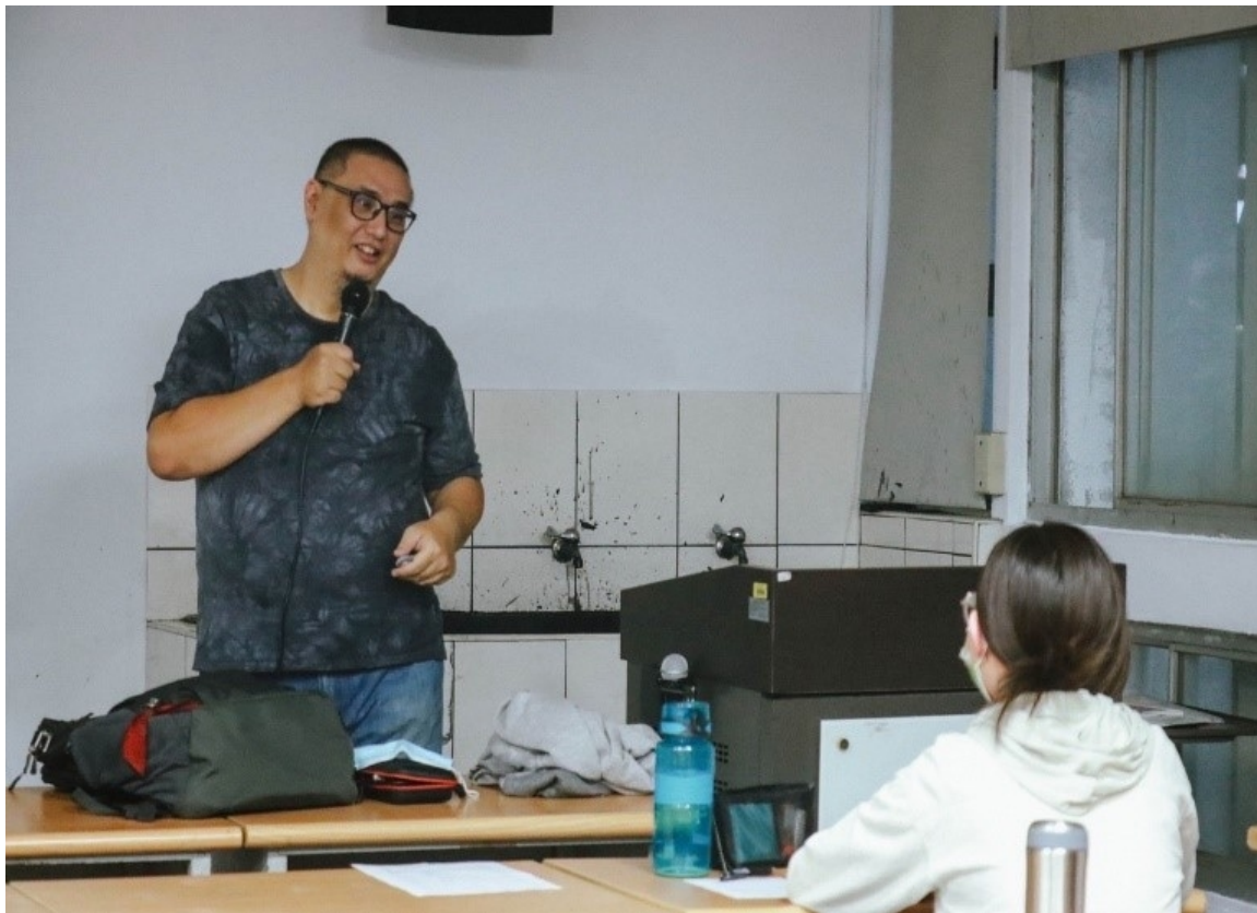
黑米老師與同學互動/提問與回答