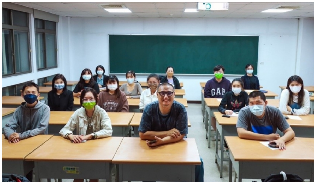
黑米老師與同學合照