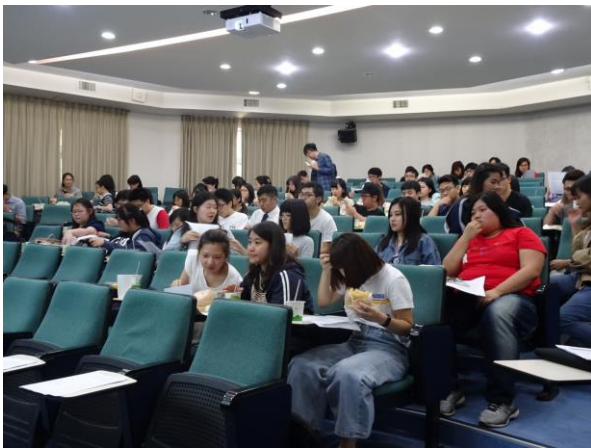
實習生專心聆聽說明會