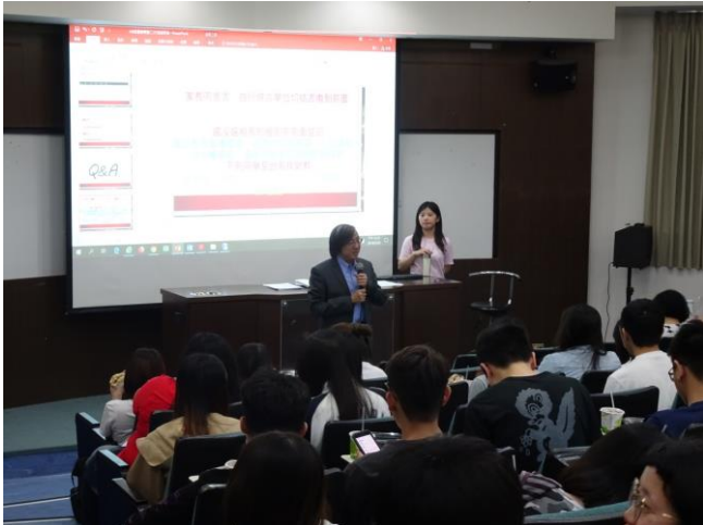
系主任到場勉勵實習生