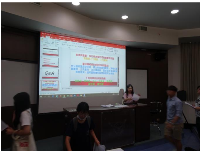
實習助教講解課程說明