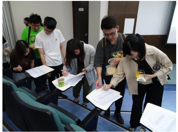
實習生簽到及索取資料