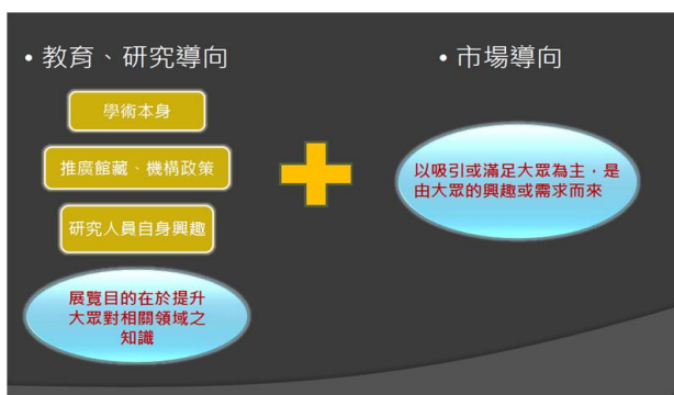
展覽主題的發想方式