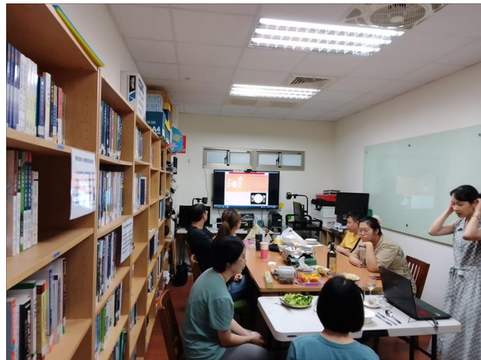
講師介紹西餐禮儀及實際操作