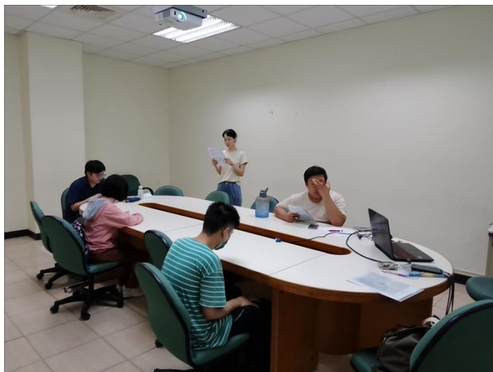
介紹本次創意英語課程總單元及相關內容

經過 6 點滿意度調查，平均滿意度為 5.3，顯示學員們對此課程持正向滿意的態度，也提供下列建議，做為日後開設外語課程參考之建議。