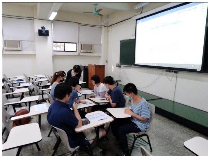
德語課程中老師個別指導基本文法