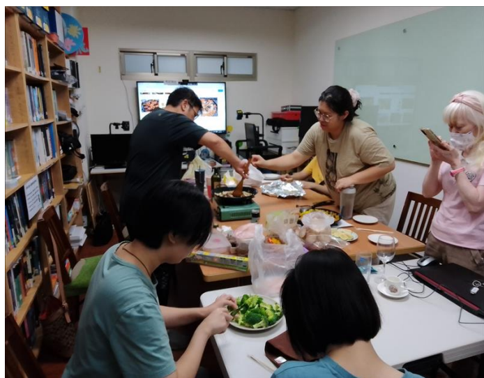
講師介紹西語發音規則