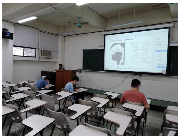
德瑞餐廳造訪，融入餐飲情境