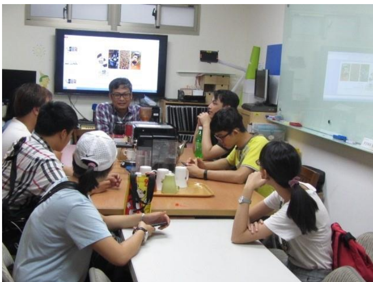
老師講解咖啡基礎知識