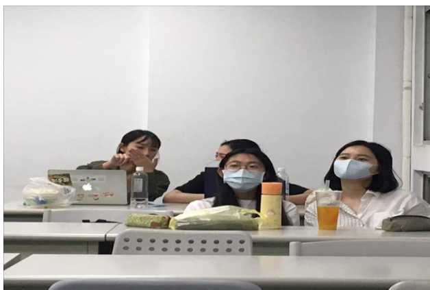
學生參與校稿遊戲：討論中