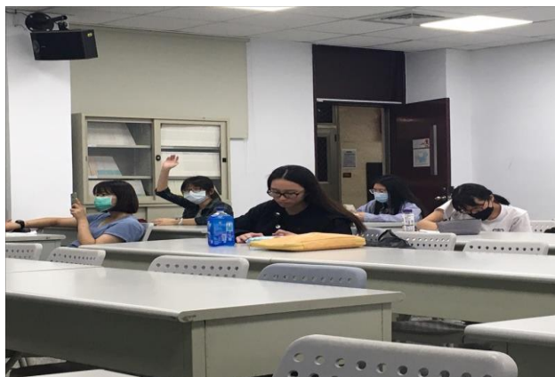
學生舉手參與課程