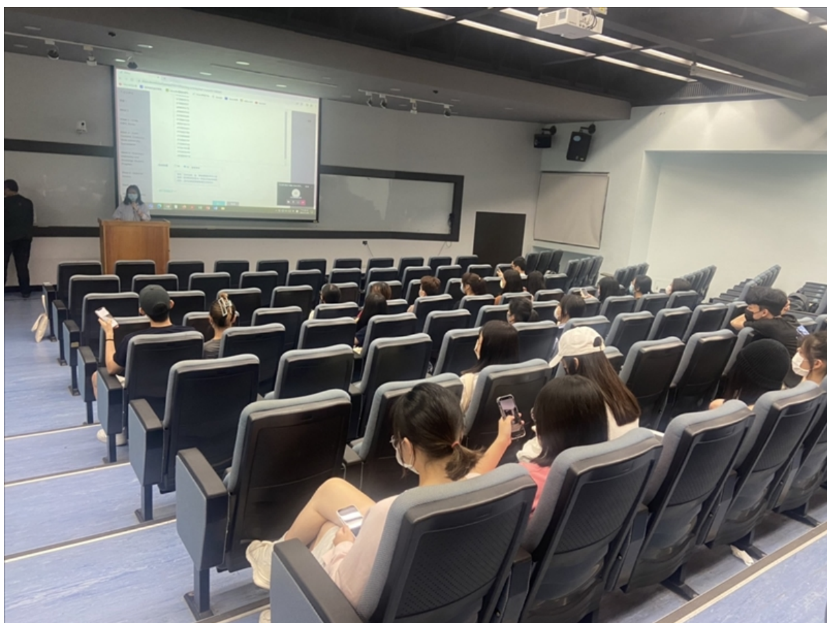
等待演講開始前先進行點名