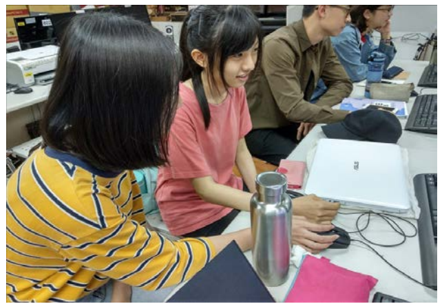
實作時間學員互相提問