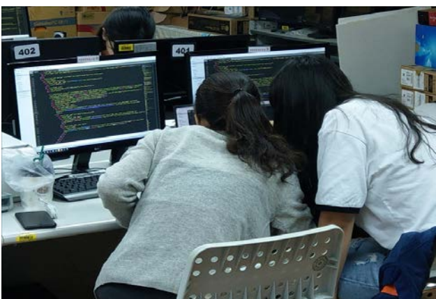
上課期間兩兩一組解決問題