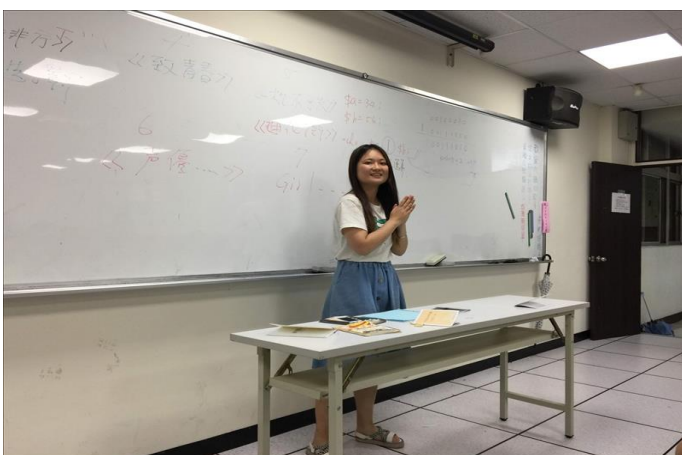
學生講解創作的故事(1)