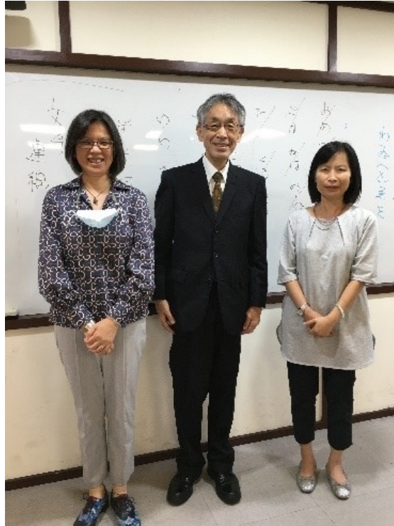
講師與校內外出席教師