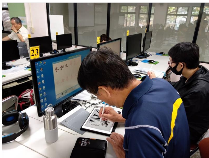
學員以 iPad 練習繪畫