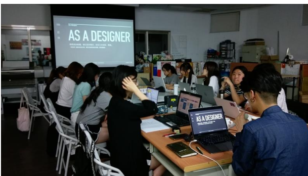
業師分享身為設計師的經驗