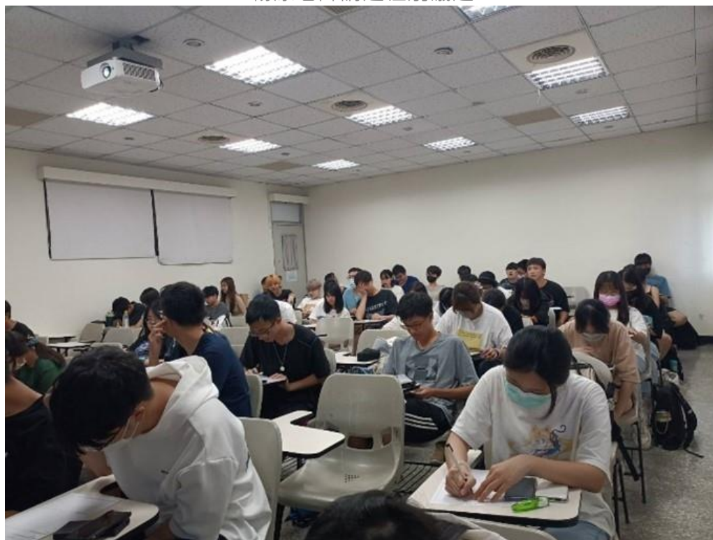
同學們仔細聆聽記下演講要點