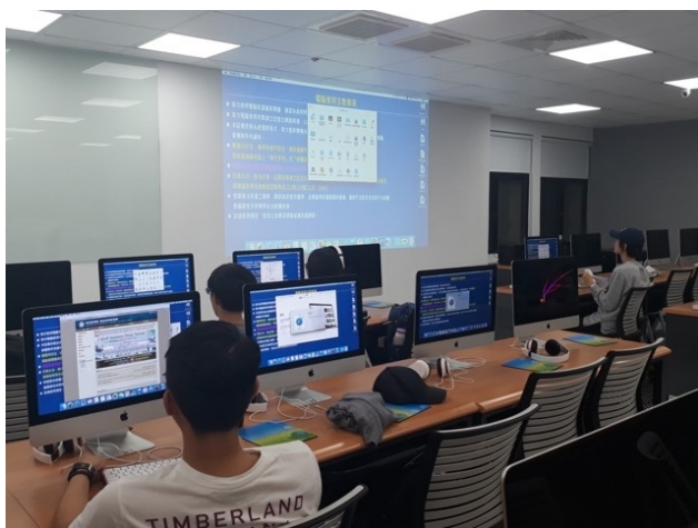
學生們跟著老師操作

課程內容介紹 MacOS 系統偏好設定，讓使用者更了解 使用 Mac 的小技巧，並且能在個人化之餘創造出更有效率的生活與工作模式；而 iCloud 可讓使用者自由地在 Mac 與 iPhone 甚至 PC 之間共享、協同及簡單地操作運轉，還有更多的 MacOS 內建系統功能，例如，磁碟工具程式、螢幕剪貼與編輯和終端機，可透過 Mac 變成工作超人，老師專業的知識與操作背景，有問必答，課堂上更額外補充很多相關資訊，可以在不同系統來做比較，讓我們更清楚明白 mac 系統的優點有多少。