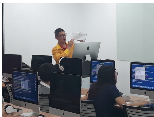
老師介紹 MAC 週邊設備的功能