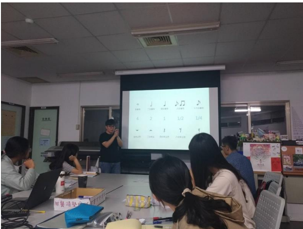
老師從簡單的樂理開始幫助學生進入狀況

課堂作業為利用 APPLE 的編曲軟體製作 32 小節曲目，可以自創和是改編，透過作業實際操作軟體及練習編曲製作。