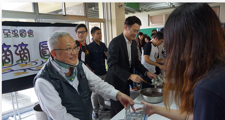
「呷滴滴，圓啊圓」冬至品嚐湯圓