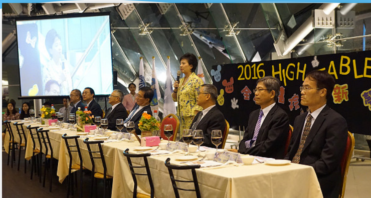
蘭陽High Table Dinner「新聲」餐會