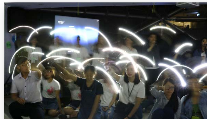
展翼歡送會 歡送畢業與出國學長姐