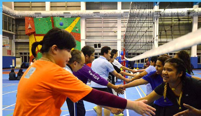
師生排球錦標賽 凝聚團隊精神