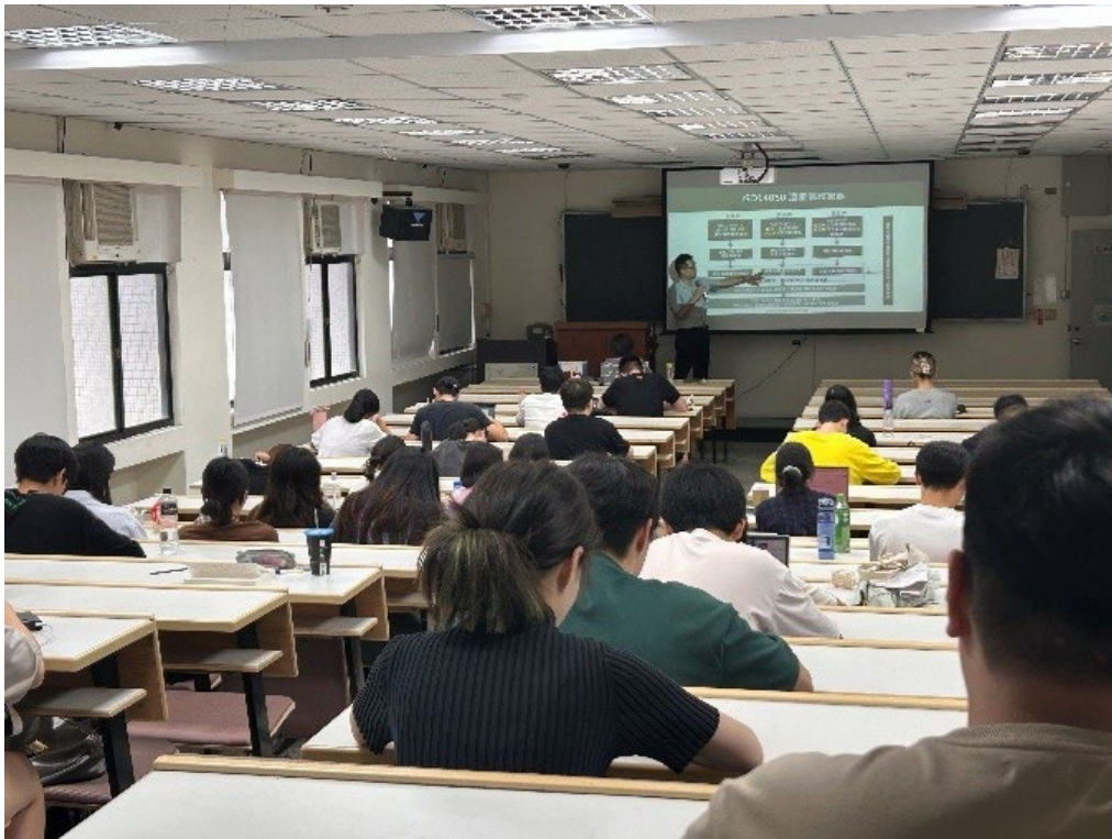
認真聽演講的同學們