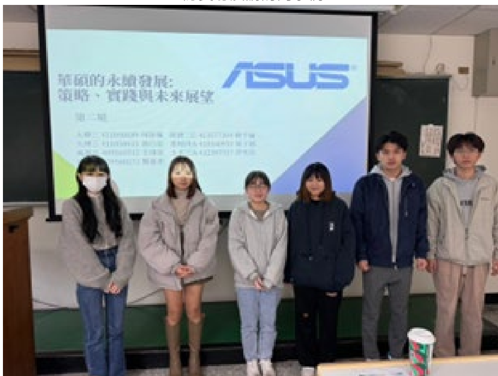
同學上台分享自己與組員對公司永續發展的調查報告