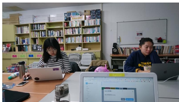
學習使用 Bootstrap 套用功能