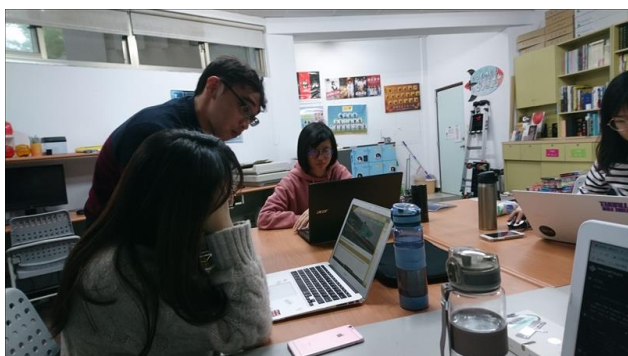
業師協助組員撰寫 JS