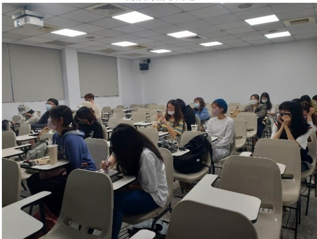
講師請同學們閱讀範例文章