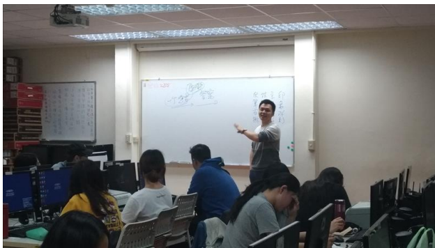
講師講解故事架構