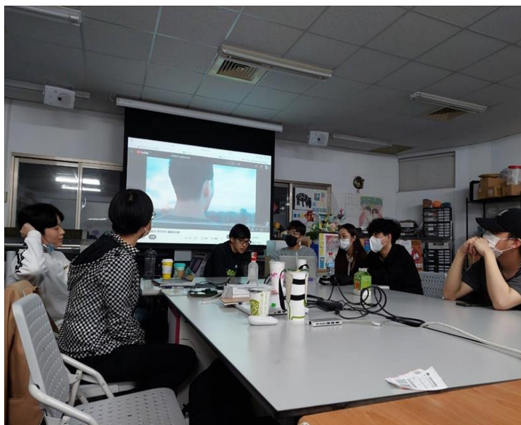
小組提案內容展示及回饋