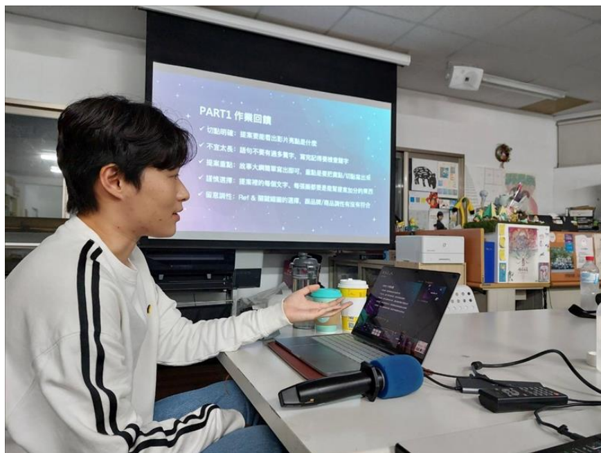
業師講解前一次作業回饋

最後是分鏡腳本的產出，業師詳細解釋了分鏡內應該要包含的內容，包括鏡數、畫面描述、分鏡/畫面示意、聲音描述/字卡、秒數以及備註欄等，並給同學們看了幾種分鏡的範例。最後業師還簡單帶到場景設定、美術規劃、妝髮造型的工作及如何安排製作時程時該注意的事項。