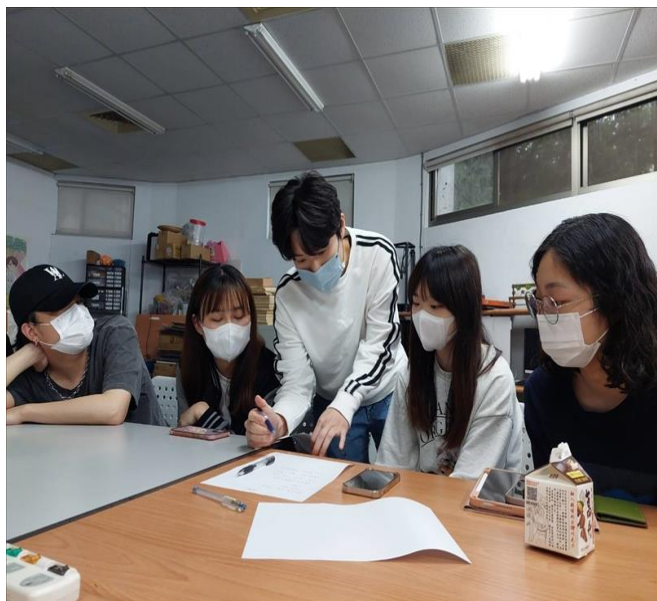
業師與同學們討論提案