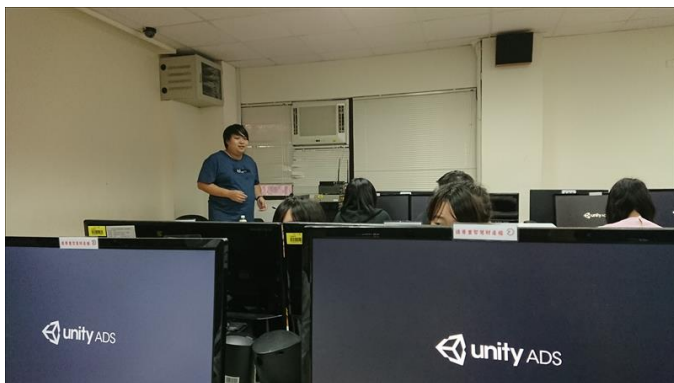
講師進行課程介紹

雖然有很多同學是第一次接觸 Unity 這套軟體，但隨著課程的推進，與講師的細心解說下，也漸漸進入狀況，相信在接下來的兩堂課程中，能從講師那邊獲得更多的收穫。共 11 位同學參與。