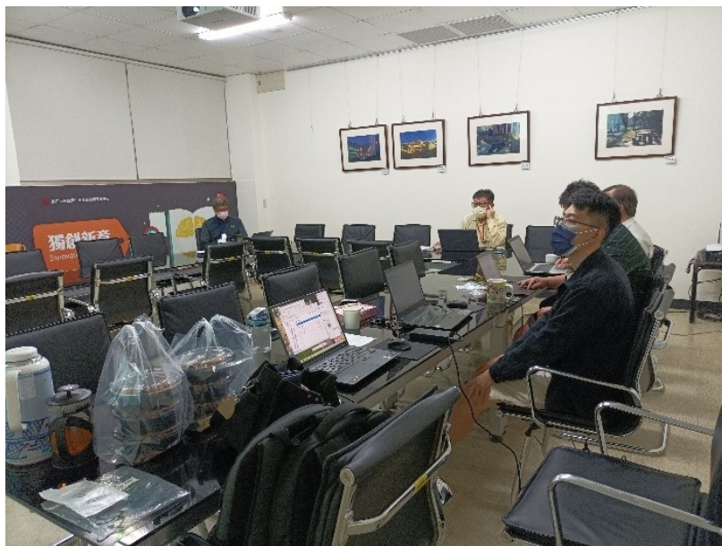
討論台灣使用 Gabi 的單位及使用原因

現今台灣環保署所利用的軟體較陽春無法較清楚得表示碳排放的路徑及製程圖，但使用 Gabi 就能較好的顯示出簡單易懂的碳排放路徑圖，運輸、電力、原料都能清楚得表達排放污染，目前台灣有使用 GaBi 軟體的機構有台灣綠色生產力基金會、環境資源研究發展基金會、中鋼、工研院、SGS、成功大學、台北大學、台北科技大學、東南科技大學、明新科技大學、亞東技術學院等，因為 Gabi 富有且獨特的視覺化製圖介面，此項特點有利於 Process Map、邊界設定、盤查資料建置及製程更新等作業，因此國際中工業界採用較多。