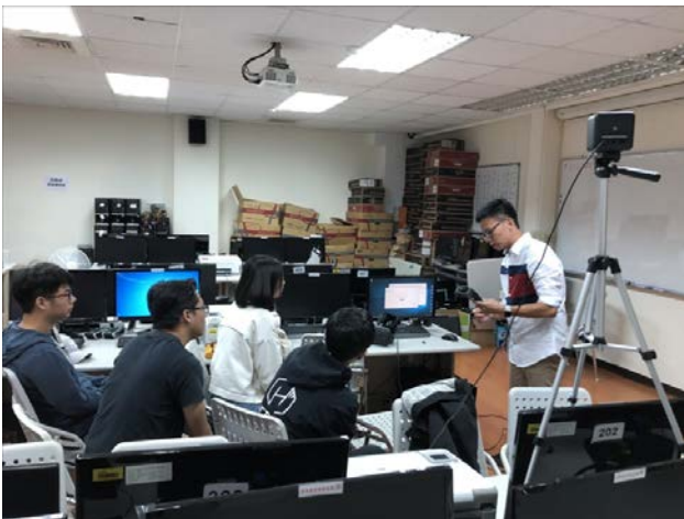
學員聽講師講解原理

講師是目前任職於夢想動畫的互動遊戲設計師，這次的教學內容主要是依照遊戲組在 12 月份的招生展中，所需要做的 VR 遊戲為主體來設計的課程，在上課前講師準備了一份自製的 VR 射擊遊戲教案，裡面有包括射擊功能、移動功能、撿取功能以及各式小技巧，例如 VR 的 UI 設計，程式的撰寫方法等等，第一天主要是介紹各式功能的用法，讓學生們一一試玩後就個別解釋程式碼以及如何更改功能，今天只有講解到射擊和移動功能，跟基礎的 VR 插件應用。