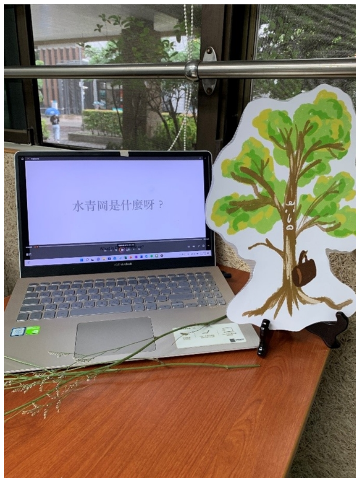
現場講解與評選委員詢答