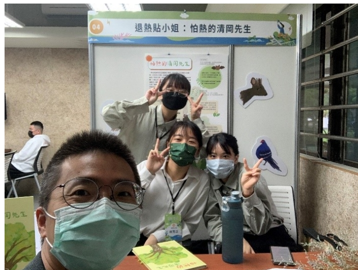
本社群教師與學生參加教育部競賽決賽