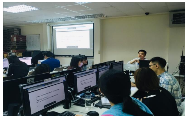
以腳本案例舉例說明